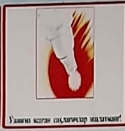
Ушани ёлган сўзларга ишлатман!