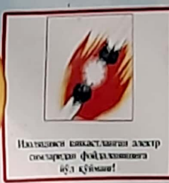
Наҳаданки ёнаётганлиги ахир сизлардан фойдаланишга буа қўйман!