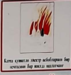
Катта қувватли ахир асбобларини ишлатганимиз бар вақтда ишлатман!