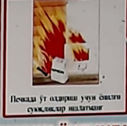
Пешвада ўт олдириш учун ёлган сўзларга ишлатман!